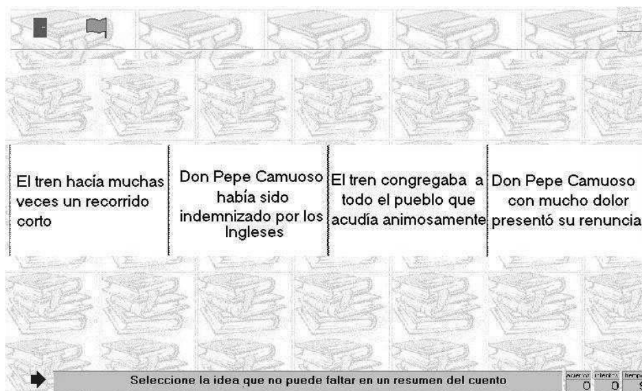
Fig.2 .- Desarrollo en Clic